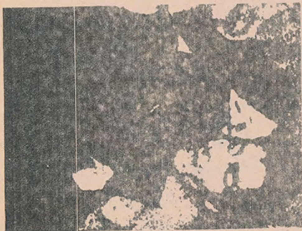
imagen extraída de un medio informativo abril/80

Aquí impresa 500 veces en este libro marginal.